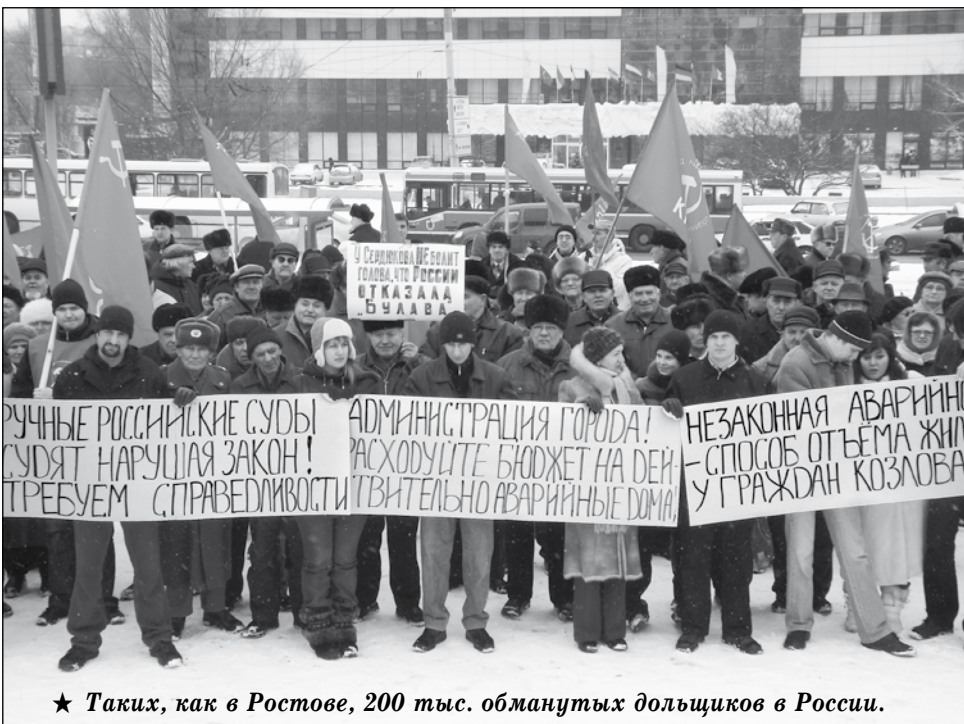
★ Таких, как в Ростове, 200 тыс. обманутых дольщиков в России.

самой трудной, престижной профессии шахтера.