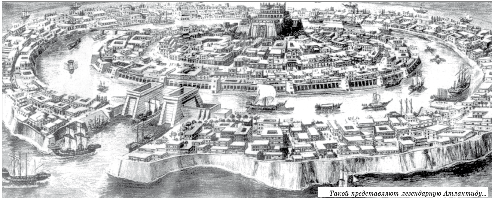
Такой представляют легендарную Атлантиду...