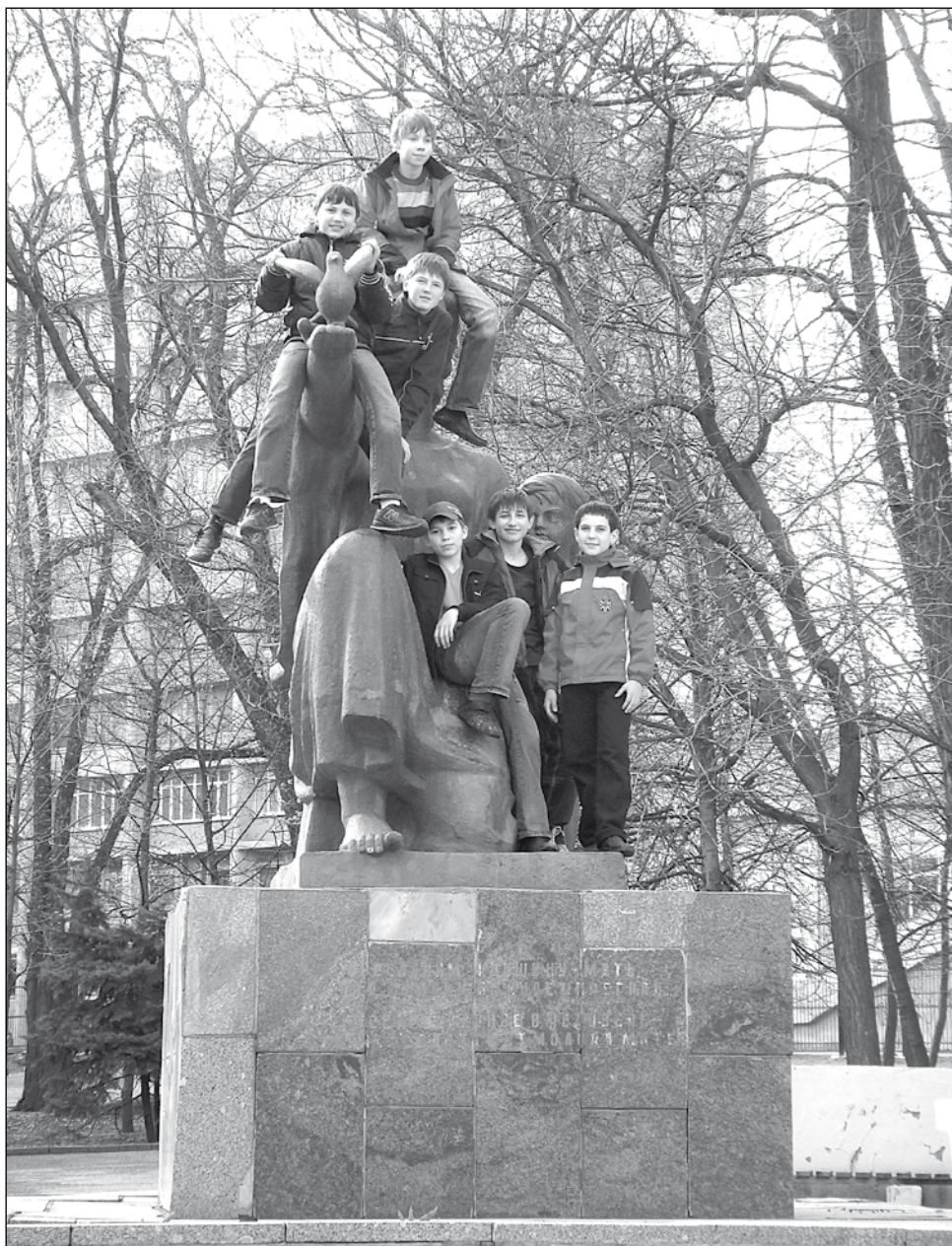
■ У памятника «Материнство»: мать-героиня!