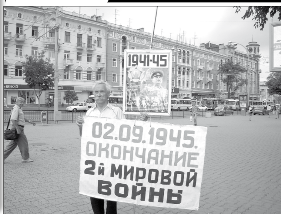
Фотозагляд на Ростов-на-Дону: 2 сентября 2010 года