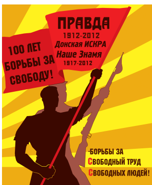
Плакат Генриха АЛЕКСАНДРОВА. Азовский р-н.