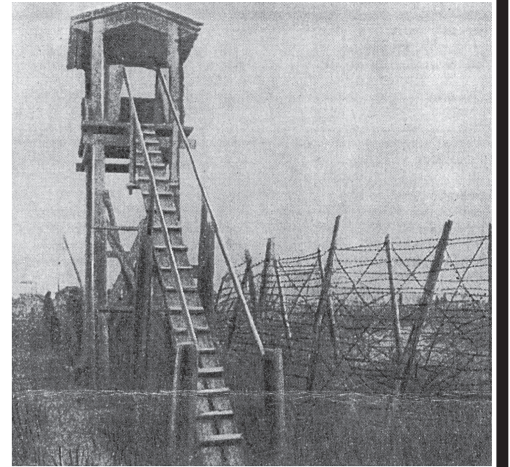
• Лагерь смерти, созданный американско-английскими интервентами на острове Мудьюг. 1918 г.

Архангельск 5 тысяч солдат. К докладу было приложено заявление британского военного представителя в Архангельске капитана Проктора, который предлагал довести численность интервентов на Севере до 15 тысяч. Однако начавшееся на Западном фронте наступление германских войск заставило союзников временно отложить эти планы. 18 апреля состоялось заседание Мурманского военного совета, на ко-