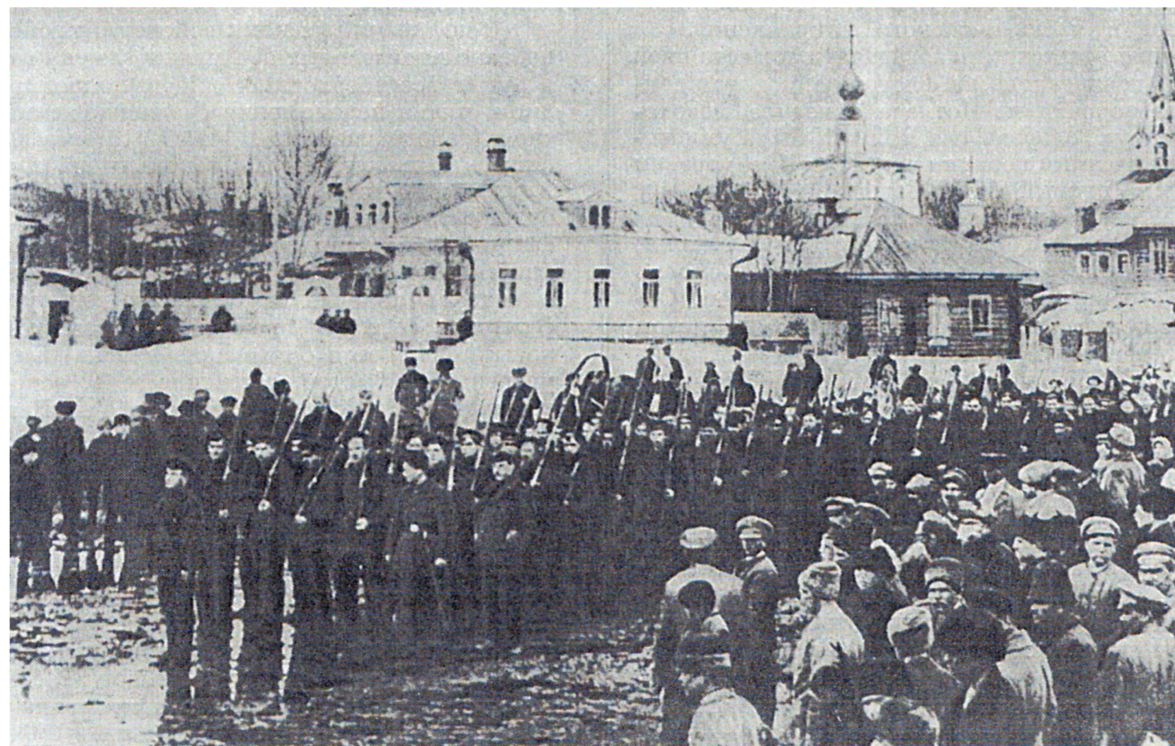
• Отряд моряков Северодвинской речной флотилии перед отправкой на фронт. Великий Устюг. Апрель 1919 г.