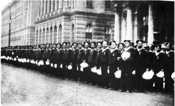
Матросы крейсера ВАРЯГ. Торжественный обед в Зимнем Дворце 16апреля 1904.

и вместе с «Корейцем» стал уходить в сторону Чемульпо. Добыча ускользала из рук японцев, уже предвкушавших близкую победу. Они бросились в погоню, но преследовать русских из-за узости фарватера могли только крейсера «Асама» и «Чиода». Последний вскоре