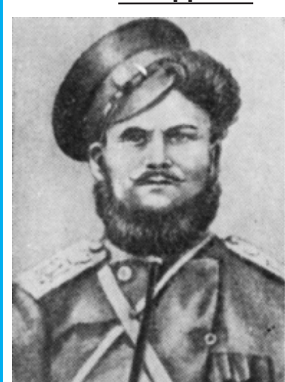
Ф. Г. Подтелков