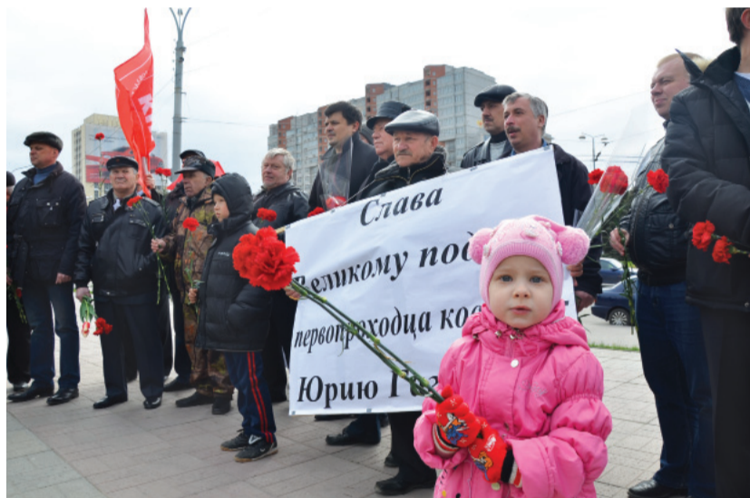
Слава победе в космосе!

★ Возложение цветов к бюсту Ю.А.Гагарина ростовскими коммунистами 12 апреля 2014 года