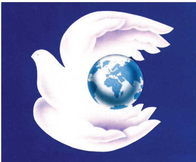
СОХРАНИМ НАШУ ПЛАНЕТУ!