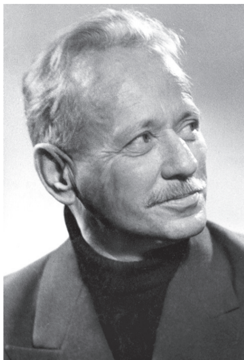
Михаил Шолохов был среди тех советских писателей, кто в первую очередь интересовал Николая Островского.

ИЗ ПЕРЕПИСКИ М. А. ШОЛОХОВА И Н. А. ОСТРОВСКОГО