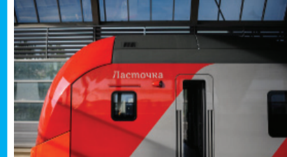
На выбор маршрута повлияла популярность «Ласточки», которая ходит из Краснодара в Сочи...