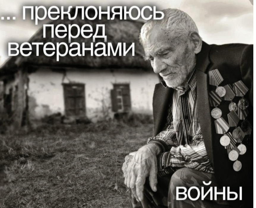
...преклоняюсь перед ветеранами войны