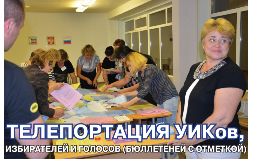
13 сентября. Иду голосовать на привычный за много лет избирательный участок №1983, расположенный в 86-й школе в Западном микрорайоне г. Ростова-на-Дону. В руках – приглашение УИКа: «Ждем Вас ... с 8.00 до 20.00»...