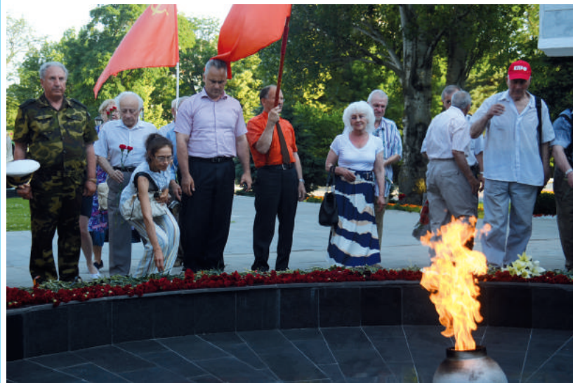
К вечному огню были возложены сотни живых цветов как символ того, что память о советских солдатах всегда жива в наших сердцах.

★ 22 июня коммунисты Ростова собрались в сквере им. Фрунзе у Вечного огня мемориального комплекса «Павшим воинам», чтобы отдать дань памяти всем, кто защищал нашу Родину в годы Великой Отечественной войны.