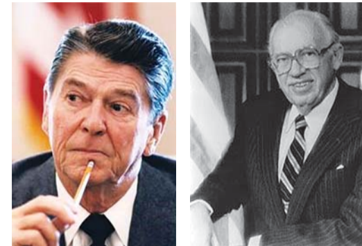
Рональд Рейган, Уильям Джозеф Кейси, Джордж Буш старший, Каспар Уиллард Уайнбергер

КАК ОДНА ИЗ ПРИЧИН РАЗВАЛА СССР Из Сибири до границ Чехословакии газопровод должен был прокладывать Советский Союз, но для прокладки требовались