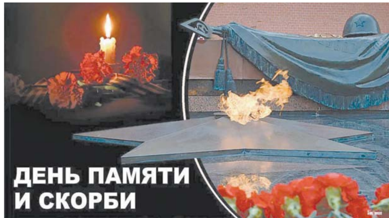
ДЕНЬ ПАМЯТИ И СКОРБИ

В этот день Гитлер обрушил военную мощь практически всей Европы на мирные города и села Советского государства. К моменту нападения враг сосредоточил на границе Советского Союза 12 армий (8 немецких, 2 румынские, 2 финские) и 4 немецких танковые группы. Против СССР нацелили 5,5 млн. чел., 191 дивизию, в т.ч. 19 танковых и 14 моторизованных. На их вооружении было: 4300 танков, 47 200 штурмовых орудий и минометов, 4980 боевых самолетов, другая техника и вооружение, что составляло: 83% сухопутных войск, из них 86% танковых и 100% моторизованных дивизий, четыре из пяти воздушных флотов люфтваффе.