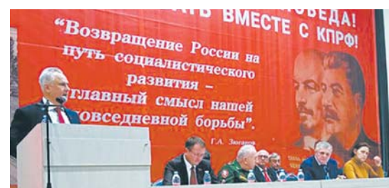
КРК по соблюдению уставных норм жизни партии.