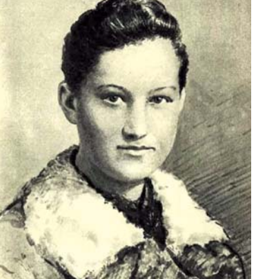
Зоя Космодемьянская. Рисунок по фотографии 1941 года

РАЗВЕДЧИКИ-ДИВЕРСАНТЫ: ЗОЯ КОСМОДЕМЬЯНСКАЯ Имя Зои Космодемьянской, наверное, первым приходит на память, когда речь заходит о женщинах на войне. Ее подвиг так подробно описан и воплощен в кино, что разобрать его по деталям не имеет смысла. О чем стоит сказать отдельно, так это о том, что нередко Зою ошибочно называют партизанкой. В действительности она была бойцом диверсионно-разведывательного отряда и официально числилась веноослужащей воинской части 9903 штаба Западного округа. Героическая жизнь и гибель Зои Космодемьянской стали одним из самых ярких символов сопротивления советского народа германской оккупации, а сама Зоя — первой женщиной, удостоенной звания Героя Советского Союза в годы Великой Отечественной войны.