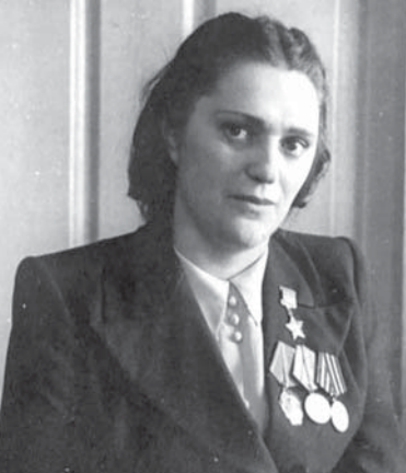
Герой Советского Союза Елена Мазаник, 1950-е годы

По числу удостоенных звания Героя Советского Союза женщины-партизаны лишь немного уступают летчицам. Высшего звания удостоены 27 партизанок, подпольщиц и диверсанток. В этом ряду – имя Елены Мазаник. А присвоено оно ей за участие в сложнейшей операции по уничтожению Вильгельма Кубе – назначенного Берлином гауляйтера Белоруссии. Вместе с нею за этот подвиг были удостоены высшей советской награды ее сподвижницы Надежда Троян и Мария Осипова, но именно Троян непосредственно исполнила приговор, вынесенный белорусским народом Кубе, ответственному за убийство 55 тысяч евреев. Это она пронесла в дом гауляйтера мину с часовым механизмом, спрятав ее в корзинке, а потом пристроила ее под матрас гауляйтерской кровати. Без двадцати час ночи 22 сентября 1943 года бомба сработала, убив Вильгельма Кубе, но не задела ни его жену, ни его детей – как и рассчитывали подпольщицы.