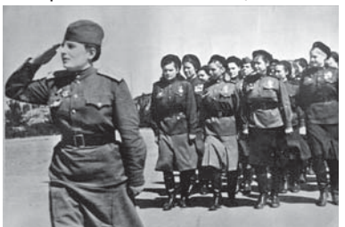
Девушки-военнослужащие 2-й гвардейской Таманской дивизии: медработники, связистки, телефонистки. Снимок сделан в двадцатых числах мая 1945 года в Кенигсберге.

Продолжение. Начало на стр. 1 за прикрытием с воздуха объектов вне зоны боевых действий, насчитывалось еще больше девушек – более 70 тысяч! Много было девушек-поваров (28 500), немалое их число – 29 259 – занимали разные должности в военных учреждениях и армейских руководящих структурах, будущи машинистками, переводчицами и так далее.