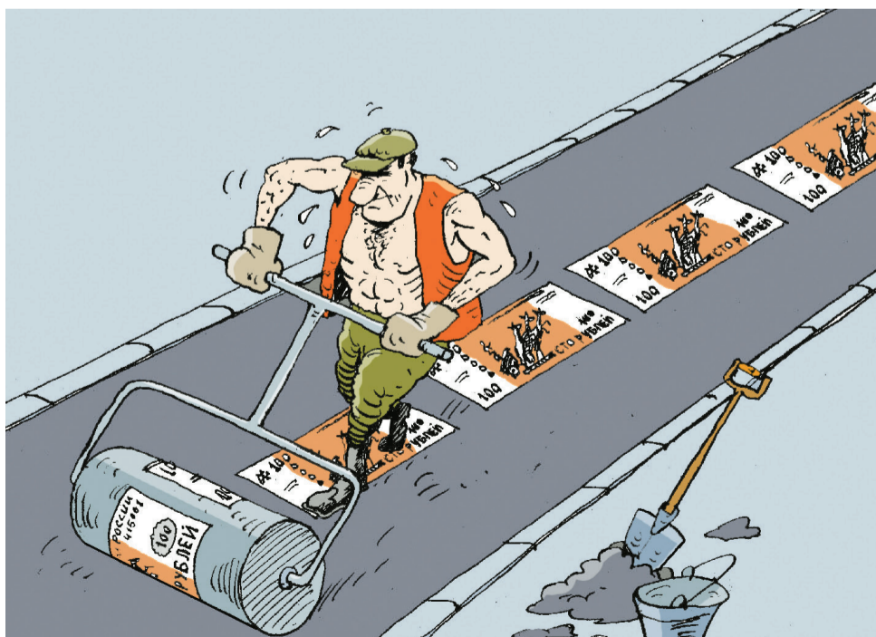
СКОЛЬКО ДЕНЕГ ЗАКАТАЛИ... А СКОЛЬКО «ОТКАТИЛИ?»